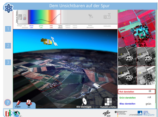
Abbildung 3 Erstellung eines Falschfarbenbildes

informieren, dass sich das elektromagnetische Spektrum nicht nur aus dem sichtbaren Licht zusammensetzt, sondern dass es weitere Wellenlängenbereiche gibt. Die Schüler/Innen sollen erkennen, dass einige Bereiche des elektromagnetischen Spektrums vom Satelliten bei der Bilderzeugung zusätzlich genutzt werden können. Entsprechend enthält der 3. Modulteil anstatt einer schematischen Landschaftsskizze ein hoch aufgelöstes Satellitenbild als Grundlage. Das