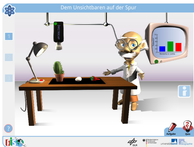
Abbildung 1 Einstieg in das Lernmodul

Im ersten Teil des Lernmoduls werden die Schüler/Innen zunächst in die Thematik der Reflexion